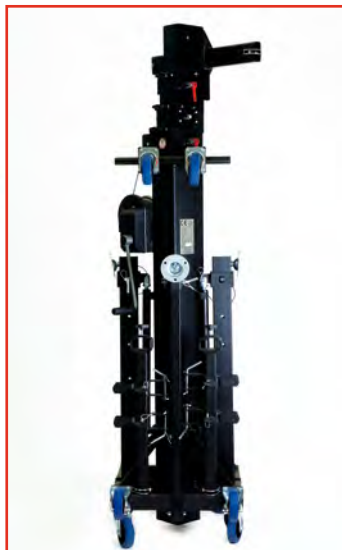
Position repliée (transport vertical)

L'ALT 600 est conçu pour monter des charges verticalement. Son système de chariot lui permet de charger la structure à 57 cm du sol. Il est équipé de rattrapage de jeux, de poulies sur roulement à billes autolubrifiées et d'un treuil auto-freiné.