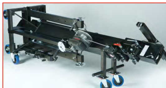
Position transport couchée