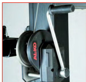
Treuil anti-retour freiné