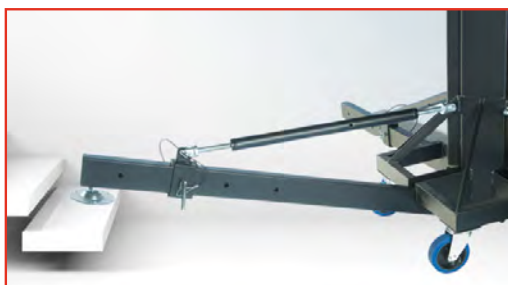
4 pattes indépendantes montées sur vérin